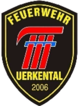
Organigramm Feuerwehr Uerkental ab 2022 Kdt und Vize Kdt bilden das Kommando