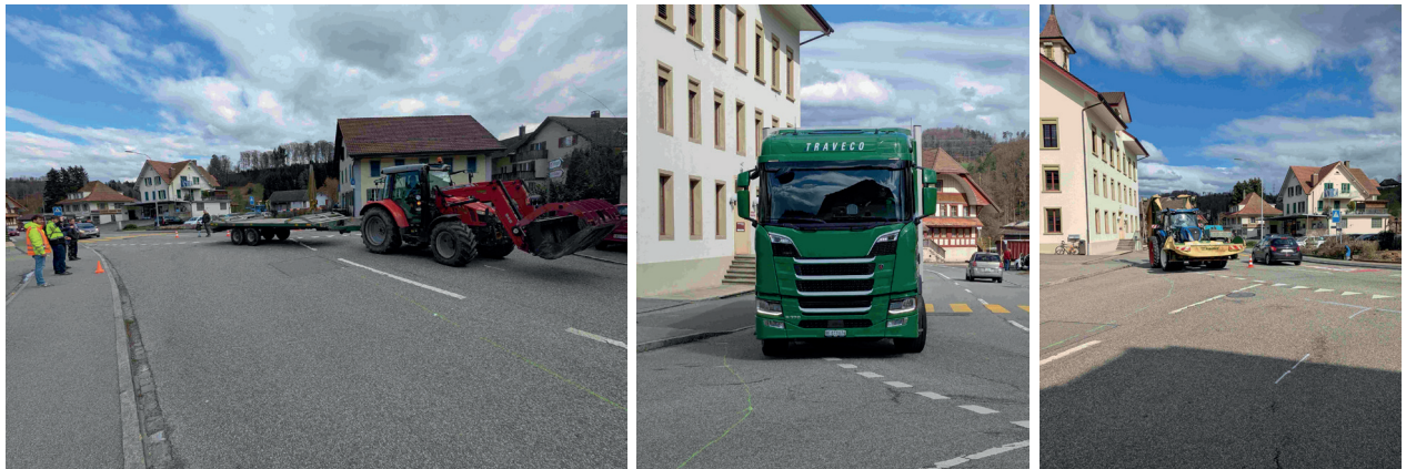
Aufnahmen aus dem Fahrversuch im März 2025

Die öffentliche Auflage zum Plangenehmigungsverfahren wird nach aktueller Einschätzung für den Zeitraum Spätsommer/Herbst 2025 erwartet. Der Gemeinderat wird, wenn immer möglich, frühzeitig über diese Termine informieren.